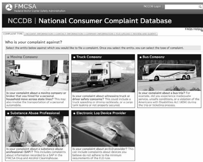
図表 3 NCCDB のウェブサイト