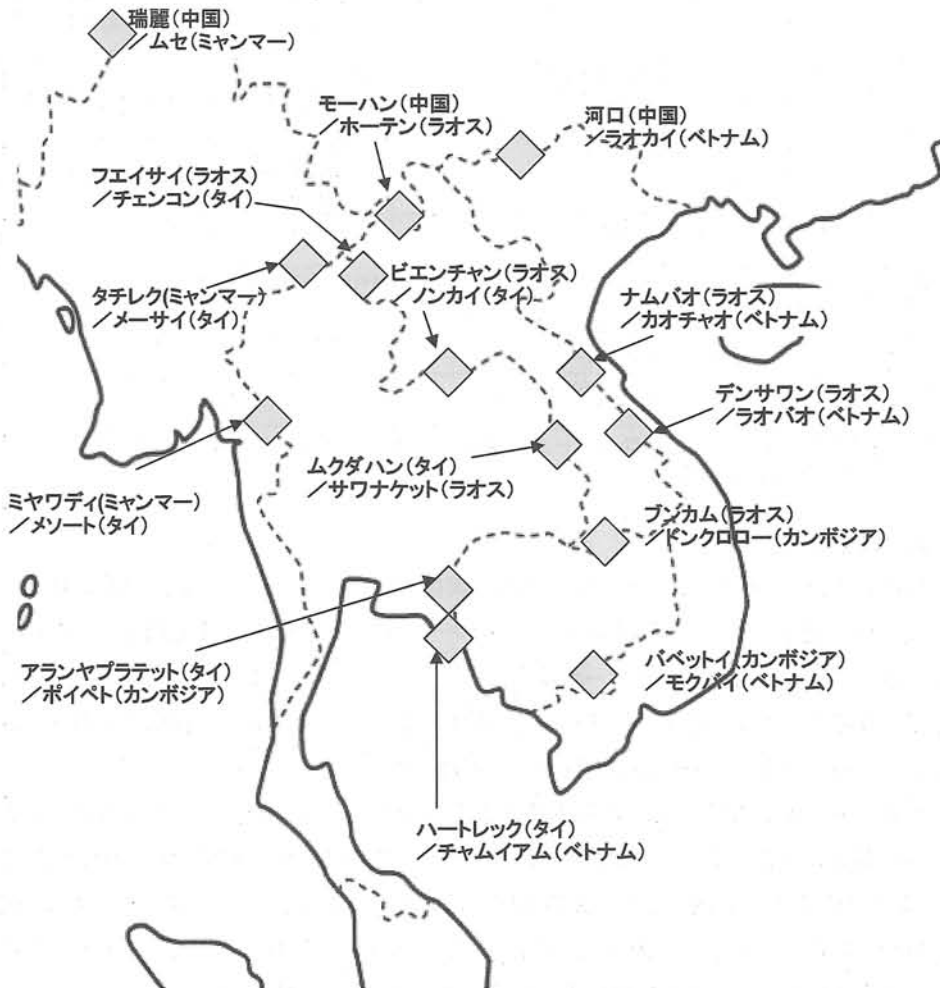
図3-1. GMS条約下で定められた国境ポイント

東西回廊のサワナケット(タイ) / ムクダハン(ラオス)、デンサワン(ラオス) / ラオバオ(ベトナム)での取り組みがテストケースとして先行して以降、対象は図3-1のような国境ポイントに拡大していく予定である。